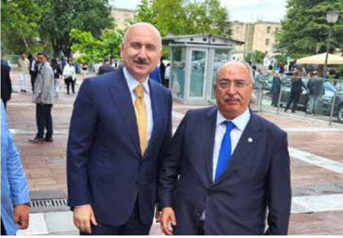
Kamu-Der genel başkanımız Cevdet BAŞTUĞ Trabzon Milletvekili Ulaştırma ve Altı Yapı Bakanı Adil Karaisamiloğlu ile meclis görüşerek hayırlı olsun dileğinde bulundu.