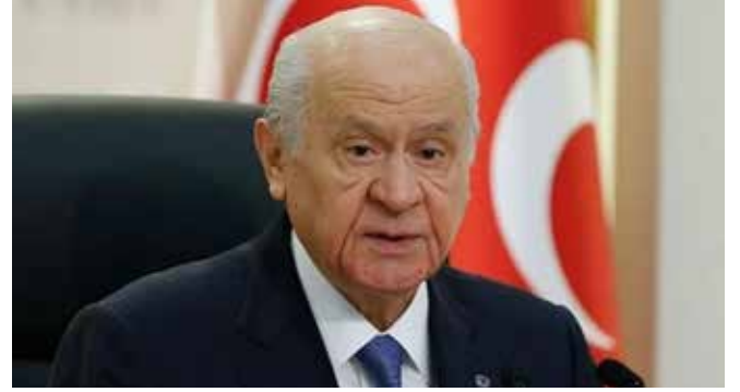
28 Dönem TBMM En Yaşlı Milletvekili Sıfatı ile Sn Devlet Bahçeli Yönetti