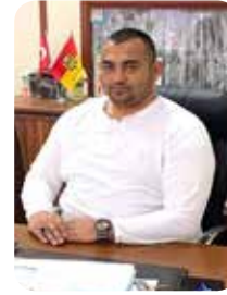
VOLKAN ATEŞ İstanbul Bahçelievler İlçe Başkanı