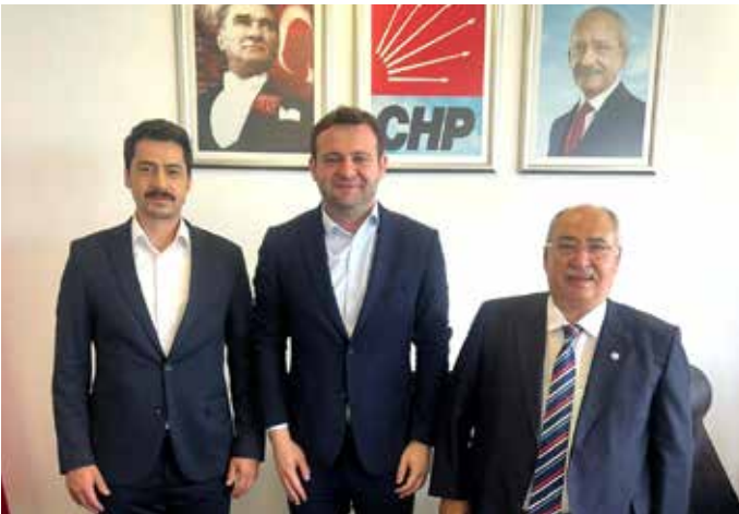
Kamu-Der Genel Başkanı Cevdet BAŞTUĞ CHP Genel Başkan Yrd. Hasan Efe Uyar Beyi makamında ziyaret ederek hayırlı olsun ziyaretinde bulundu Sn. Uyar Beyin yakın ilgisinden dolayı teşekkür ederiz.