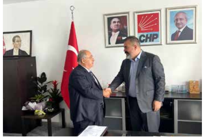
Kamu-Der Genel Başkanı Cevdet BAŞTUĞ CHP Genel Başkanı Yrd. Barış Devrim Çelik Beye hayırlı olsun ziyaretinde bulundu Sn Çelik ilgisinden dolayı tebrik ederiz.