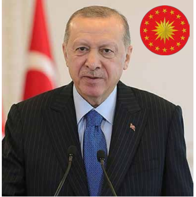
RECEP TAYYİP ERDOĞAN 13. Cumhurbaşkanı

Seçimlerde ittifak yapan partilerin bazı adayları ittifak yaptıkları diğer partilerin listesinden seçime girdiler. Seçim sonrasında;