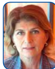
Mevsim Tolay Kepez İlçe Temsilcisi